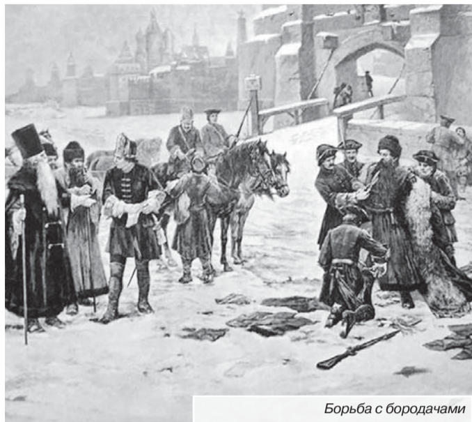
Борьба с бородачами