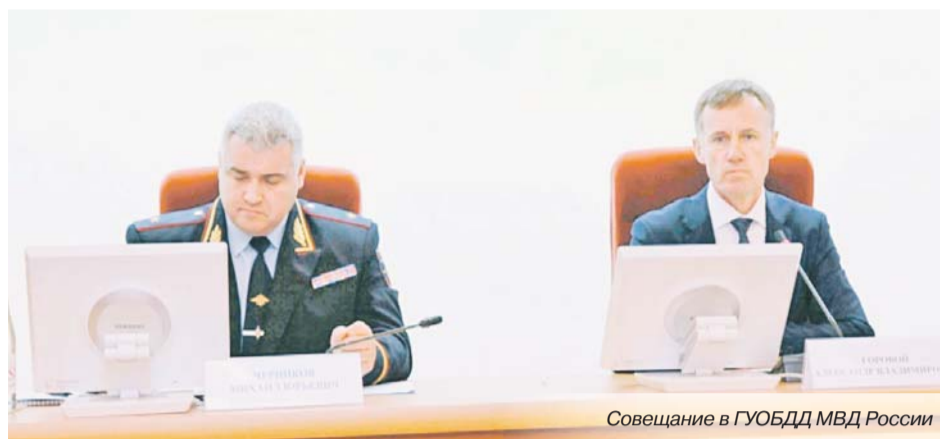
Совещание в ГУОБДД МВД России