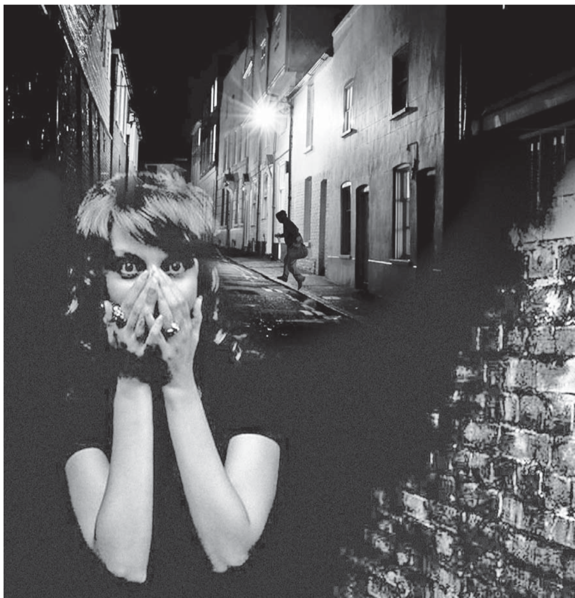
Коллаж Евгения КАРТАШОВА

Последняя новость меня вновь повергла в изумление.